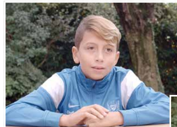
Portraits issus du film #EtToiTuFeraisQuoi avec une baguette magique ? 1 er prix de la catégorie Vidéo aux Palmes de la Communication 2016

Le marketing social consiste, pour l'ADSEA 06, à associer à l'action une communication qui lui permet d'accroître sa notoriété, de valoriser, à travers son image, son expertise et ses missions.