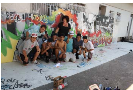
Deuxième inauguration de la fresque du souterrain de la gare d'Antibes, 16 juin 2012

« La Fresque réalisée par les jeunes a été inaugurée le 16 Juin 2012 à 18h en présence des élus de la ville d'Antibes, du Conseil Régional, de l'Education Nationale, de la SNCF et des partenaires du projet (Gare et Connections- Gare d'Antibes- Centre de Formation du Bâtiment d'Antibes – Direction Jeunesse loisirs de la ville d'Antibes – ADSEA06/ UPT). 12 Jeunes ont participé à cette journée clôturant un travail en amont important. Une belle journée, une belle fresque, un bel objectif. »