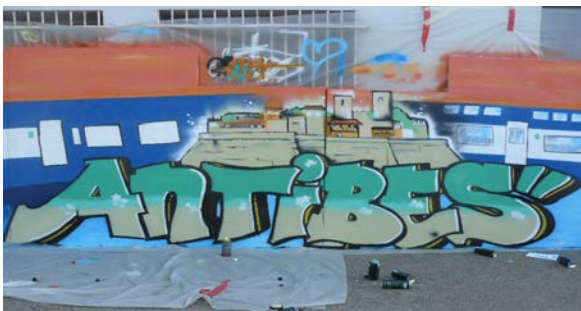
Inauguration de la fresque du souterrain de la gare d'Antibes, 14 juin 2008

Les actions collectives autour d'un projet révèlent un partenariat important et de qualité avec les partenaires SNCF et la Région PACA, des centres de formation et du service jeunesse de la Ville d'Antibes.