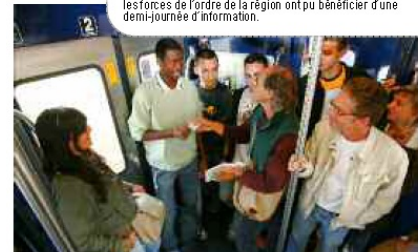
Pour bien connaître les risques liés à l'environnement ferroviaire dans lequel elles sont amenées à intervenir, les forces de l'ordre de la région ont pu bénéficier d'une demi-journée d'information.

L'autre volet de la lutte contre l'insécurité dans les gares et les trains est la prévention. Prévention en interne, par la formation des contrôleurs à la gestion des conflits. Savoir quel comportement adopter face à l'agressivité ou à l'incivilité permet souvent de ne pas envenimer les situations conflictuelles. Prévention dans les trains en les équipant de matériel vidéo, qui enregistre les événements, ce qui a un effet dissuasif sur les personnes mal attentionnées. À ce jour, la région Provence-Alpes-Côte d'Azur compte une quarantaine de rames pourvues de vidéo, et espère voir son parc entièrement équipé dans les années à venir. Prévention en direction des jeunes, enfin :