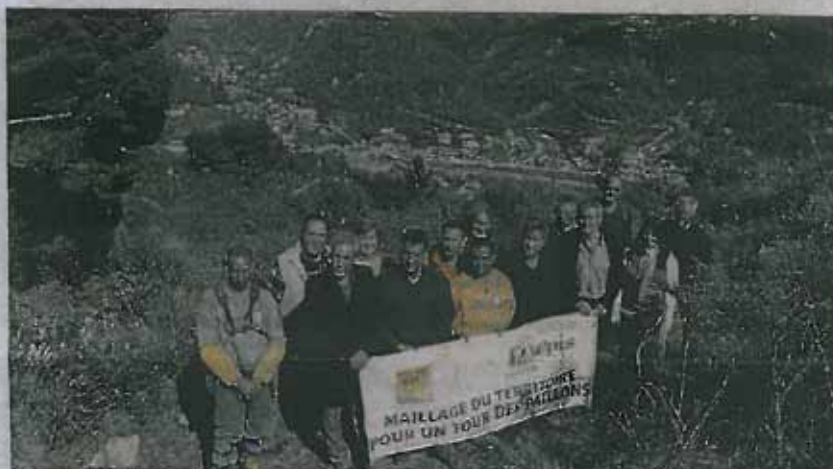
Les acteurs de l'opération sur l'un des sentiers débroussaillés qui domine une partie de la vallée des Paillons.